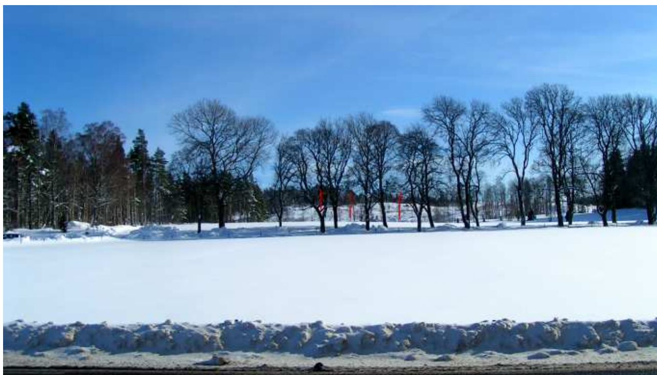
Visualisering från Örebrovägen vid Rå, 3,4 kilometer från etableringen. Till vänster i bild syns det befintliga verket vid Hulsta. För att ange storlek och position visas verken i rött.

I det större traktperspektivet kommer vindkraftverken att ha en minimal påverkan av landskapsbilden. Från Örebrovägen kommer verken att synas enbart där längre fria siktlinjer förekommer. Och i sådana fall kommer enbart vingpetsarna synas över skogen.