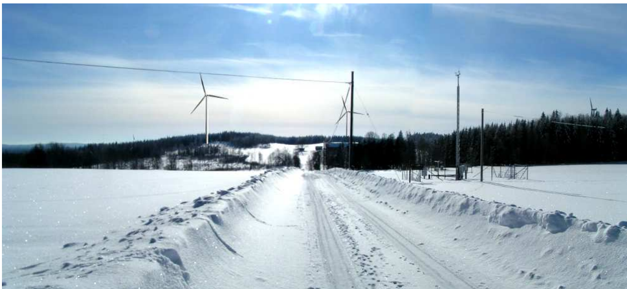
Visualisering från Stora Kettstaka, drygt 800 meter från verk 2. Till höger i bilden syns verket vid Hulta.

I etableringens närområde blir landskapets öppenhet samt terrängens topografi avgörande för påverkan av landskapsbilden. Från exempelvis Stora Kettstaka, med sitt öppna odlingslandskap och fria siktlinjer mot etableringen, kommer verken att utgöra ett påtagligt inslag i landskapsbilden.