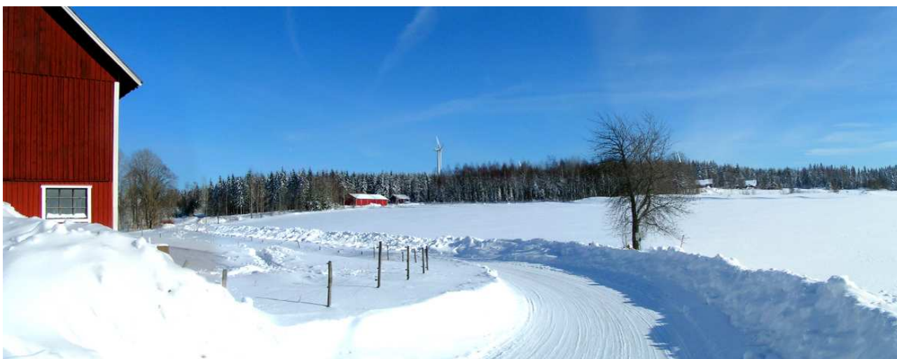
Visualisering från Hulta, 1,3 kilometer från etableringen. Verket vid Hulta syns mitt i bilden.

Från Hulta, som också har ett öppet landskap runt bebyggelsen, "döljs" däremot etableringen nästan helt på grund av landskapets topografi. Enbart verkens vingspetsar kommer synas över skogen till höger om verket vid Hulta.