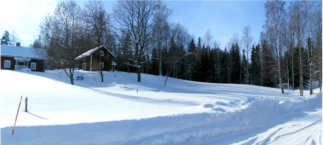
Visualisering från Stora Ekebrunn 750 meter från det närmaste verket på Lilla Kettstaka.